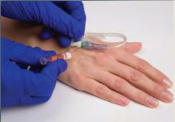
Curativos periféricos IV